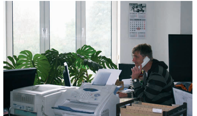
STANELLE® ofis ve üretim tesisleri