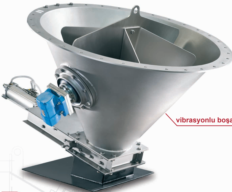
vibrasyonlu boşaltma bunkeri

Stanelle vibrasyon boşaltım ekipmanı zor akan, tozlu, kalıplaşan, granüllü ve kuru ürünlerin boşaltılması için kullanılır. Her türlü mevcut silonuz altına sonradan da uygulanabilir. Vibrasyon boşaltım ekipmanı her tür vibrasyon motoru ile aktive edilebilir.