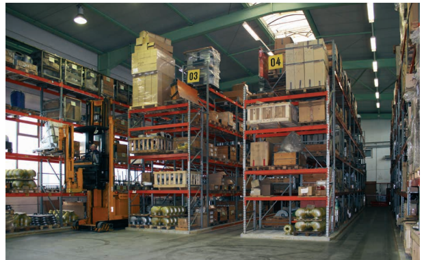
724 paletlik depo alanımız